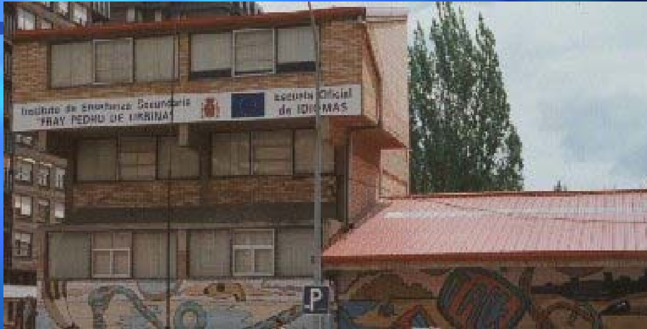
Miranda de Ebro